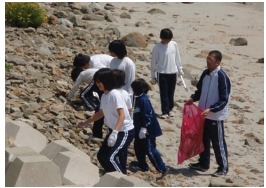
灘小学校・海岸清掃