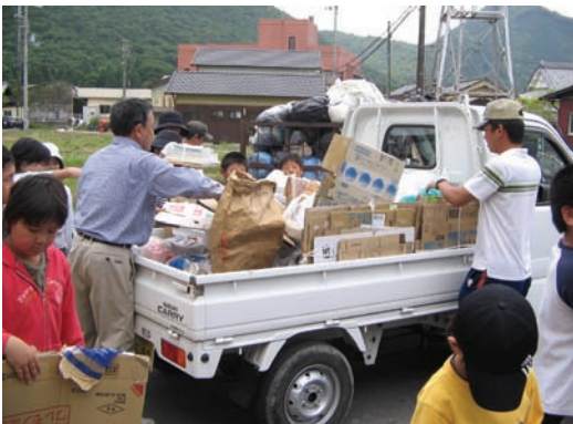
比延小学校・資源ごみ回収