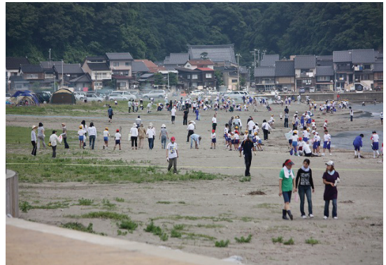
港中学校・気比の浜清掃