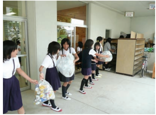
日置小学校・児童会アルミ缶回収