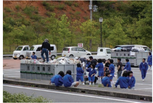
八千代中学校・PTA 資源ごみ回収