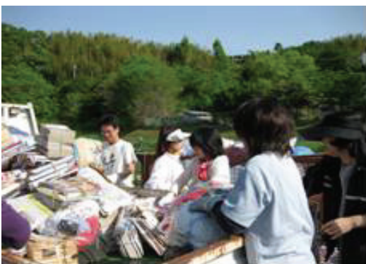
中吉川小学校・PTA リサイクル活動