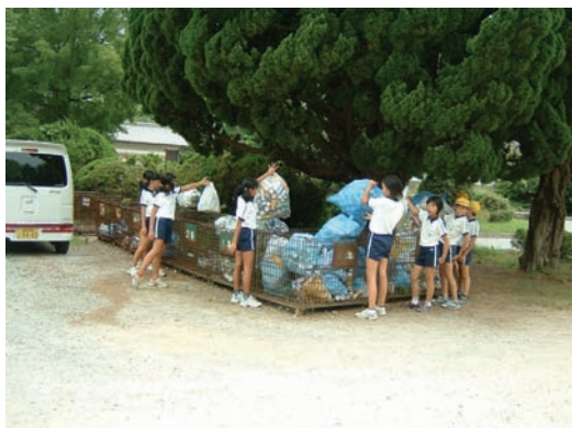
下里小学校・クリーンアップ大作戦