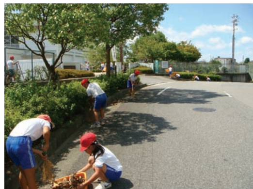
北条東小学校・学校周辺清掃