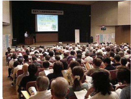
ごみ減量等推進員研修会