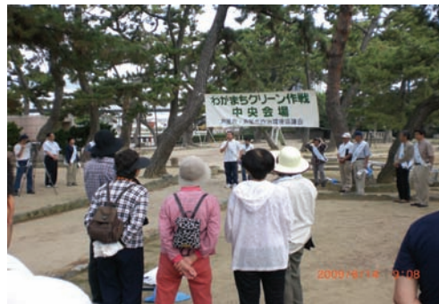
春のわがまちクリーン作戦