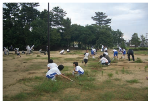
別府中学校・クリーン作戦