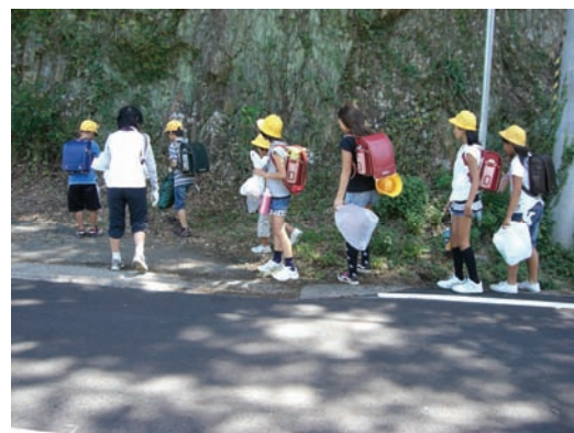
米田小学校・校外クリーン作戦