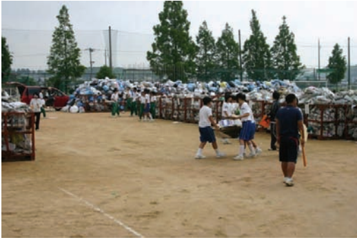
小野南中学校・廃品回収