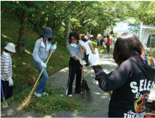
中田小学校・PTA 草刈作業