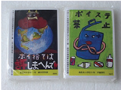
クリーンアップひょうごキャンペーン 啓発ポケットティッシュ