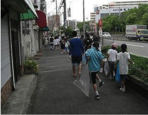
わがまちクリーン大作戦