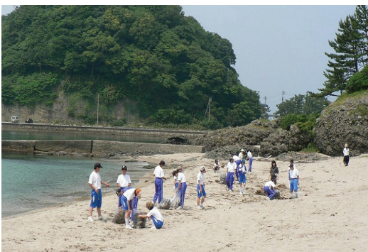
竹野中学校・竹野浜清掃