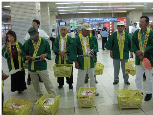
クリーンキャンペーン