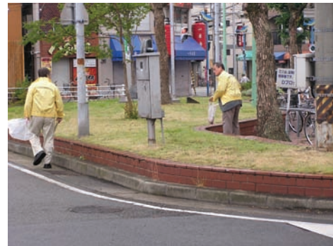
鷹取駅前クリーンキャンペーン