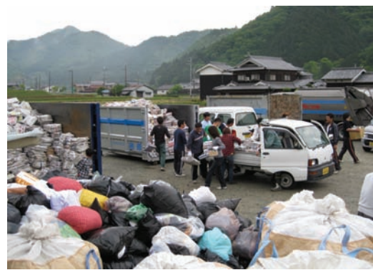
八千代北小学校・資源ごみ回収