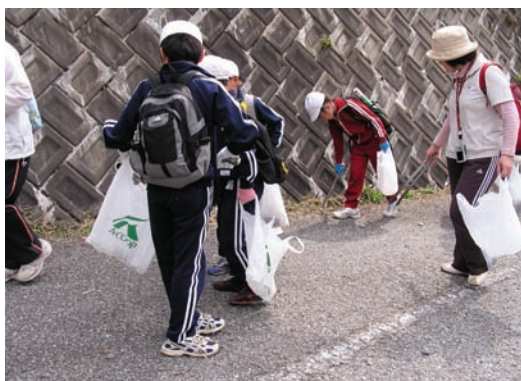
川上小学校・砥峰クリーン作戦