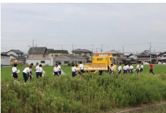
氷丘中学校・別府川清掃