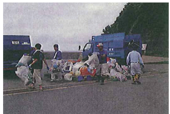
ビーチウォーク&クリーンアップ大作戦