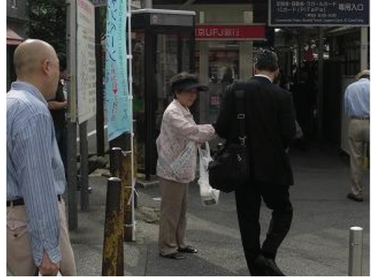
駅前キャンペーン