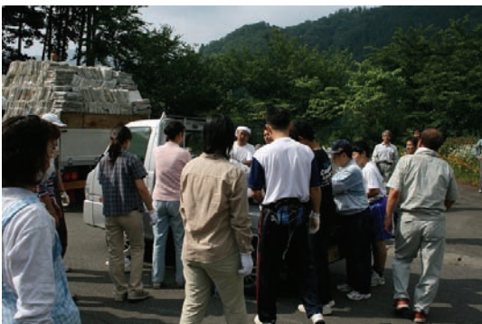
竹野南小学校・リサイクル活動