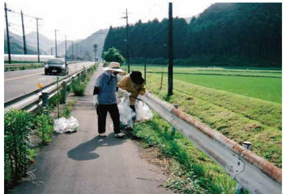
丹波一斉クリーン作戦