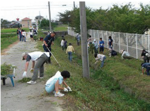
天満南小学校・PTA 合同奉仕作業