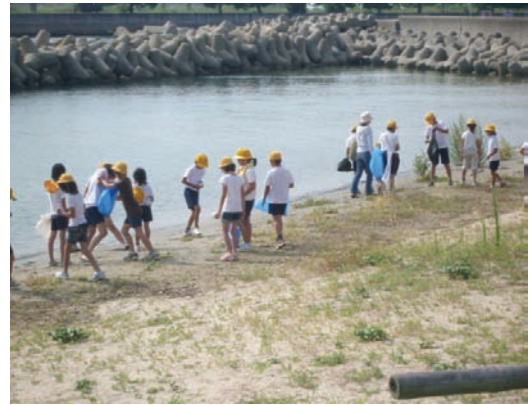
佐野小学校・海岸清掃