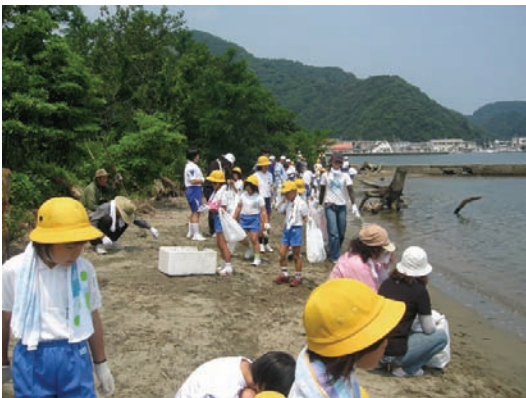
港東小学校・気比の浜清掃