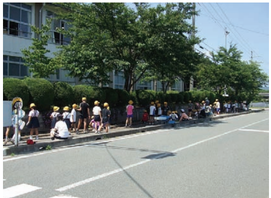
奈佐小学校・花の道づくり