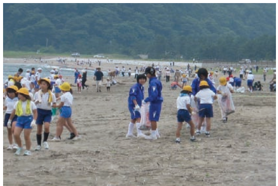
港西小学校・浜清掃