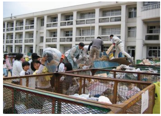
上吉川小学校・PTA 廃品回収