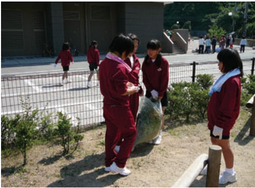
坊勢中学校・島内清掃