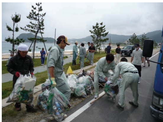
海岸漂着ごみクリーンアップ