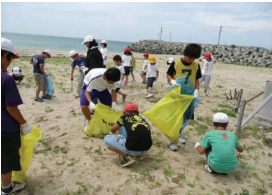
室津小学校・児童会ボランティア活動