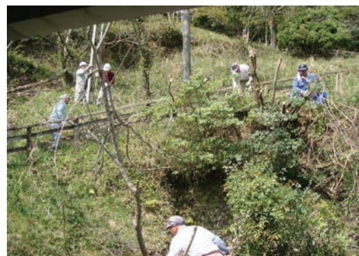
大山小学校・裏山道枝伐採