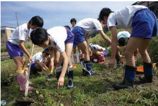
出石中学校・谷山川清掃