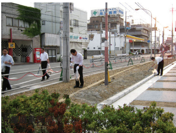
東播磨版クリーンアップ大作戦