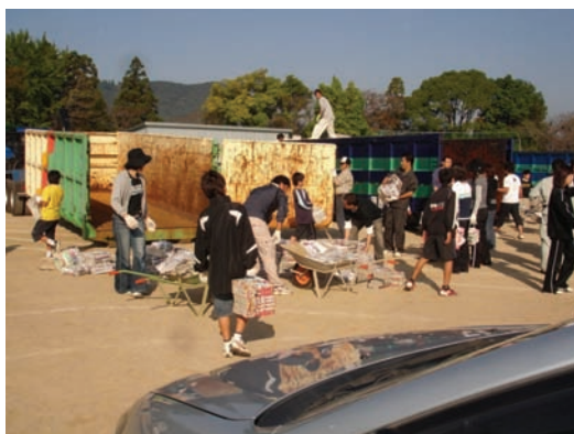
滝野東小学校・資源ごみ回収