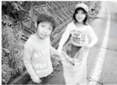
ごみ拾いに励む参加者の中には子どもの姿も(山本区)

市民みんなでまちをきれいに 市は5月31日と6月7の両日「クリーン但馬10万人大作戦」を実施しました。 これは、「ごみのない美しい地域づくりをしよう」と但馬各市町が統一事業として毎年行っているもの。市内各地でたくさんの方が参加し、自分たちの住んでいるまちをきれいにしようとしてごみ袋を手に空き缶や空きびん、ごみ拾いに精を出しました。この両日に集まったごみは約38ト(昨年約53ト)。朝来市建設業協会の支援を受けたダンプカー1延べ百3台によってクリーン