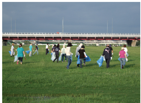
加古川河川敷清掃