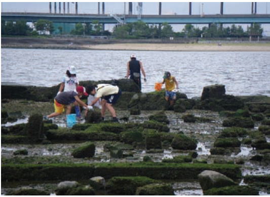
みんなの浜辺調査